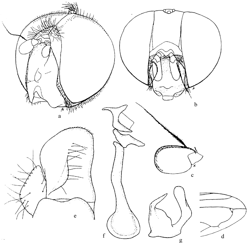
图 257 维多利亚黑蚜蝇 Cheilosia victoria (Hervé-Bazin)

部光亮无粉被；颜狭，两侧几乎平行，除中突和口缘外，黑色，具蓝色光泽，无毛，中突宽；眼缘狭，最宽处狭于第3触角节的1/2，褐色，密被银色粉被和白色短卧毛；颊低，被白色粉被和同色毛；新月片暗褐色；触角窝分开。复眼几乎裸，上面1/4具少量白色短毛，两眼连角为 90^\circ ，其连线明显长于额。触角主要黄色，第3节明显长，被褐色长毛；芒明显被毛。肩胛褐色，被灰色粉被，中胸背板亮黑色，具蓝色光泽，前半部具灰粉条纹，两侧被长而粗的黑鬃；小盾片光亮，黑色，前缘具狭褐色粉被条纹，后缘被黄色长毛和黑色粗鬃；盾下缘纓长而密，黄色；侧板黑色，被薄的灰色粉被和黄色毛。足主要黄色，仅中后足基节、跗节端节和后足腿节顶端1/5黑色；前足腿节毛长，白色，中足腿节毛黄色，后足腿节淡色部分毛黄色，暗色部分毛黑色，后足腿节腹侧黑色毛短。翅 m_{1+2} 和 r_{4+5} 脉间的内角为 90^\circ 。平衡棒黄色；腋瓣白色，边黄色。腹部黑色，密被褐色粉被，第3节两侧及第4节光亮，具蓝色光泽；毛长，直立，两侧和各节基半部毛金黄色，其余黑色。